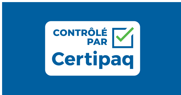
FOND BLEU CERTIPAQ