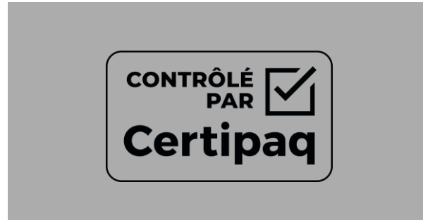
FOND NOIR > 50%