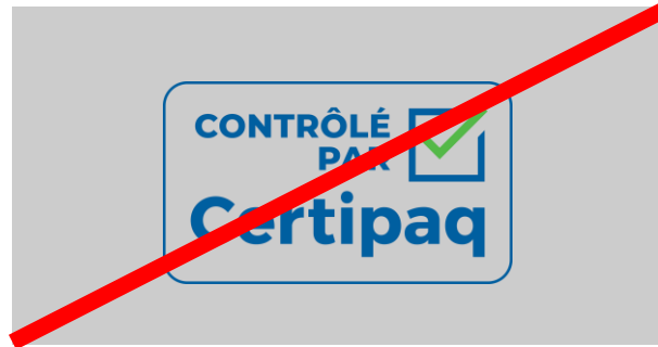
FOND NOIR < 80%