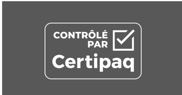
FOND NOIR < 90%