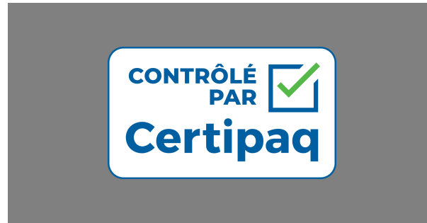
FOND NOIR 50%