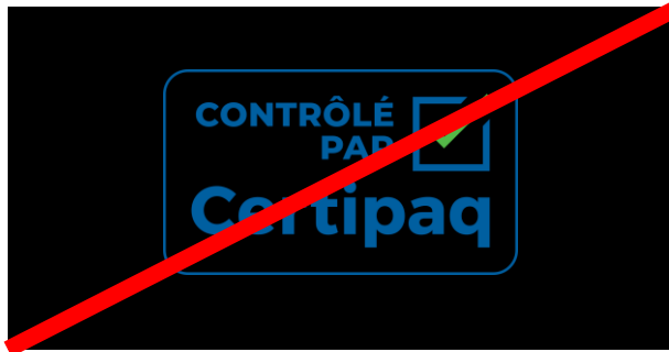
FOND NOIR 0%