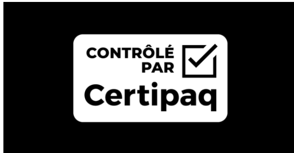
FOND NOIR 0%