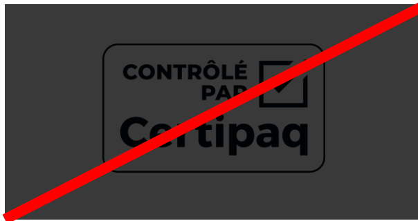
FOND NOIR < 50%