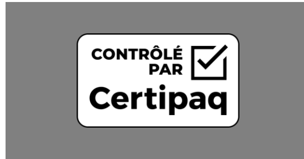
FOND NOIR 50%