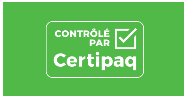
FOND VERT CERTIPAQ

Le logo évidé ne s'applique qu'en blanc sur les fonds de couleurs, limités au vert et bleu «Certipaq »