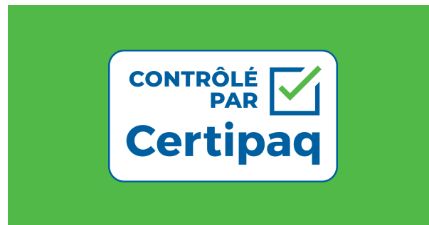
FOND VERT CERTIPAQ