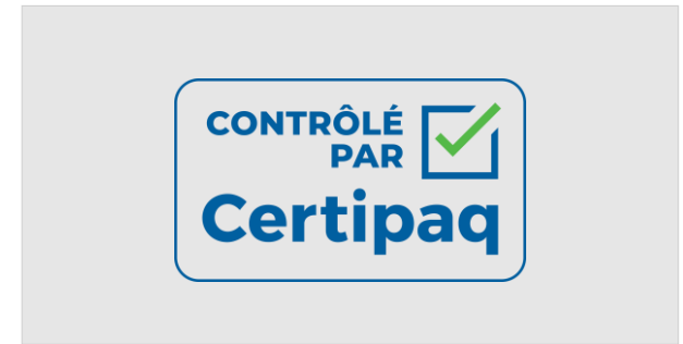
FOND NOIR > 80%