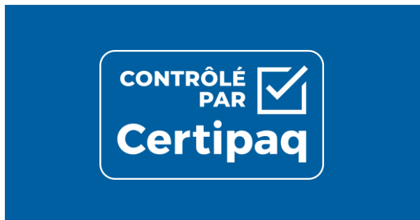
FOND BLEU CERTIPAQ