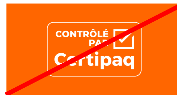
FOND TONIQUE OU TOUTE COULEUR