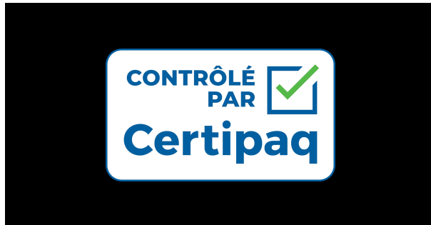
FOND NOIR 0%