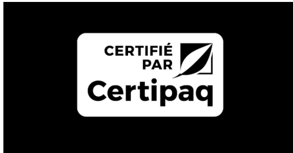
FOND NOIR 0%