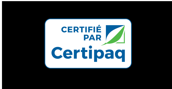
FOND NOIR 0%