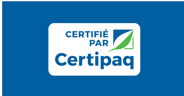
FOND BLEU CERTIPAQ