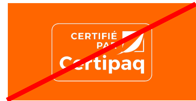
FOND TONIQUE OU TOUTE COULEUR