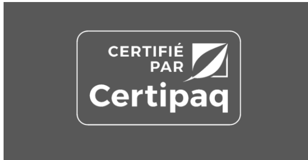
FOND NOIR < 90%