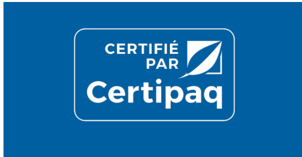
FOND BLEU CERTIPAQ