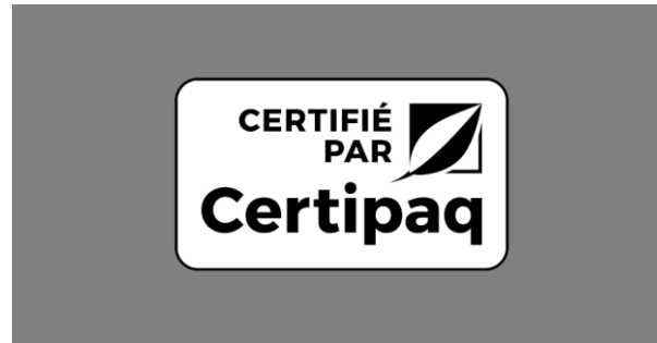
FOND NOIR 50%