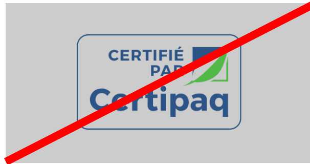
FOND NOIR < 80%