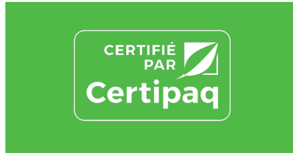
FOND VERT CERTIPAQ

Le logo évidé ne s'applique qu'en blanc sur les fonds de couleurs, limités au vert et bleu «Certipaq »