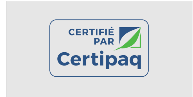
FOND NOIR > 80%