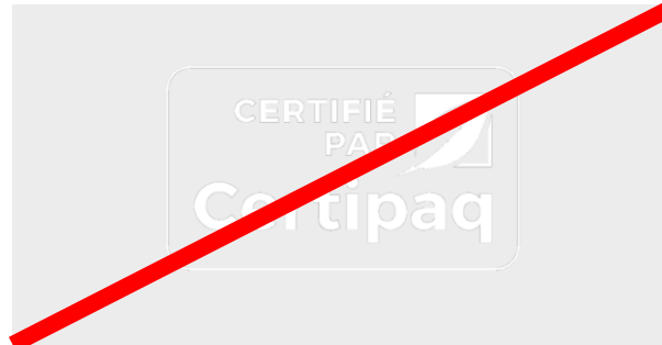
FOND NOIR > 90%