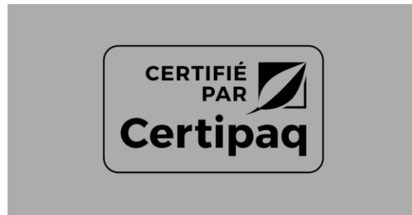
FOND NOIR > 50%