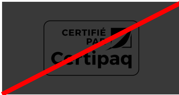
FOND NOIR < 50%