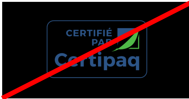
FOND NOIR 0%